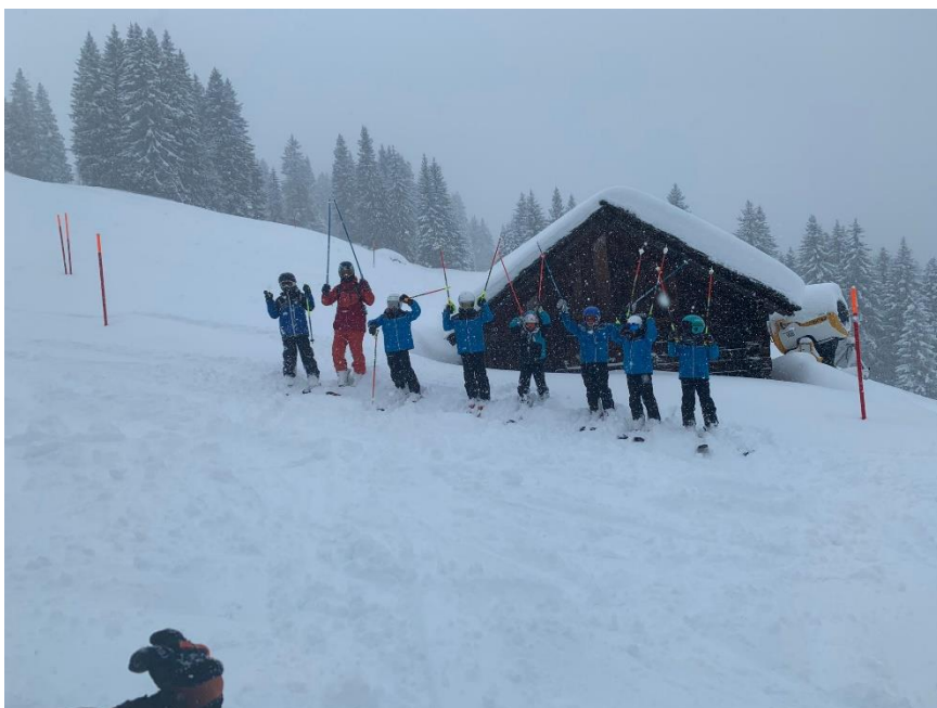
La relève teste le Freeride 1

Les précipitations du 27 décembre 2019, n'ont malheureusement pas été suivies. Les skieuses et les skieurs prêts à en découdre, ont dû s'armer de patience, pour voir les premières courses. Beaucoup d'annulation par manque de neige pour commencer, suivi d'une fin de saison précipitée par le début du 1 er confinement.