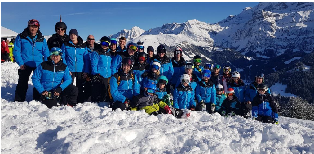
Le Mouret à la Lenk 1

Ce camp nous a permis d'étendre également nos relations avec le ski club Alpina Bulle. Nous avons partagé la piste d'entraînement. C'est stimulant aussi pour chacun de se confronter avec des skieurs d'un autre club, contre lequel nous concourons toute la saison en coupe fribourgeoise et romande.